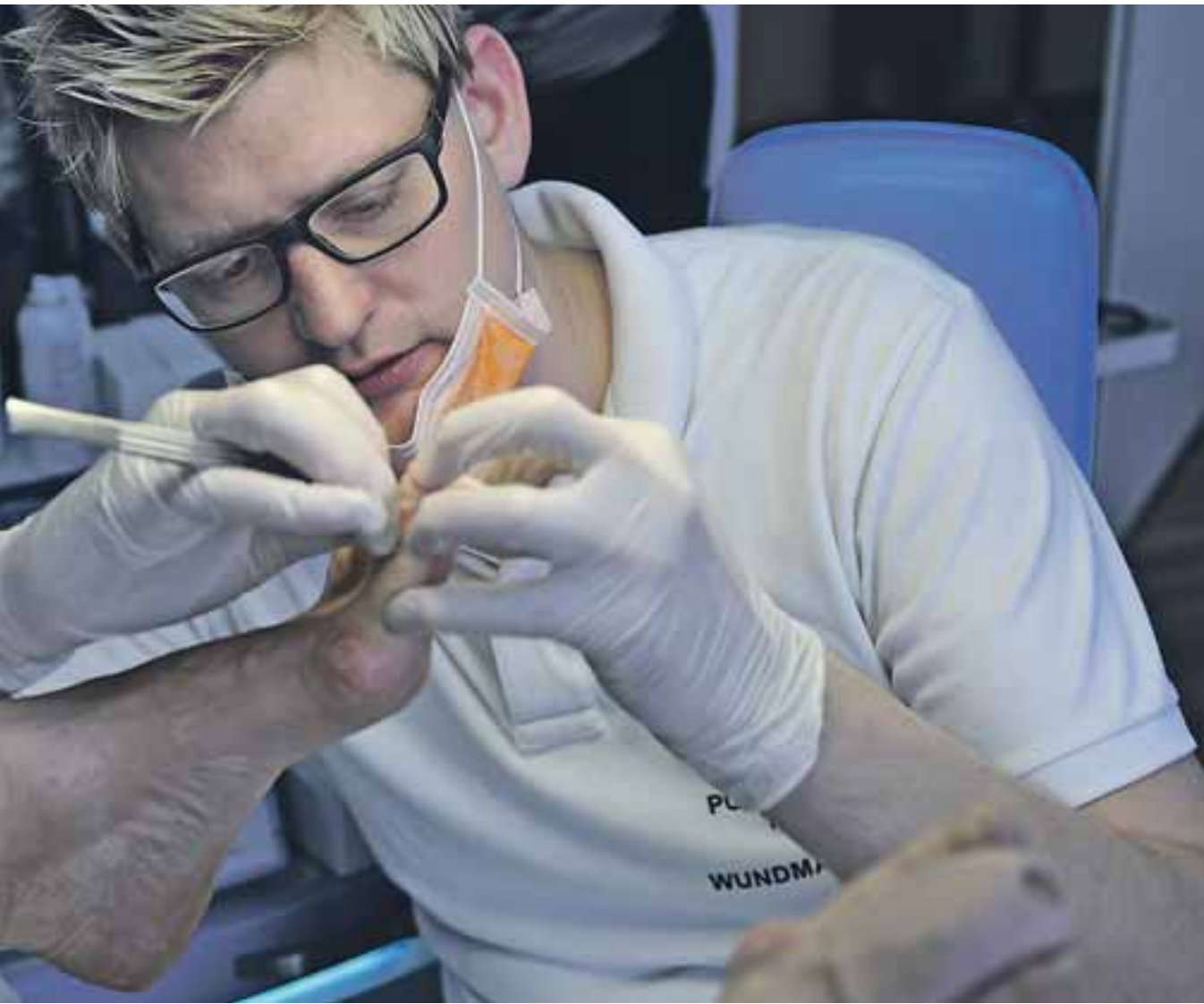
Diabetes-Gesellschaft bietet Assistenzpersonal Fortbildungen zum Wundassistenten DDG an.