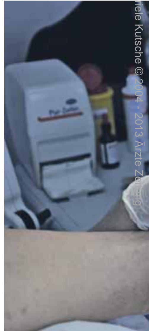
Fußpflege bei einem Diabetiker: Die Deutsche

Fazit: Mit einer externen Zweitmeinung lassen sich Amputationen verhindern, so die Ärzte. Hinweise auf mögliche Schäden durch das Verfahren gab es nicht. Auch Kliniken mit ausgewiesener Expertise haben von den externen Erfahrungen profitiert.